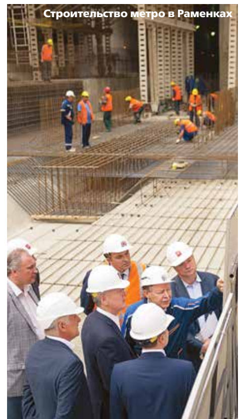
Сергею Собянину удалось запустить и начать реализовывать новые программы развития практически по всем направлениям городской политики

Москва — это не только 90 млн кв. м дорог, 23 тыс. дворов и 30 тыс. домов, но и 12