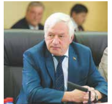
Председатель Московской городской избирательной комиссии В. Горбунов

Председатель Мосгоризбиркома Валентин Горбунов на заседании президиума напомнил, что с 15 августа в Москве начнется размещение на-