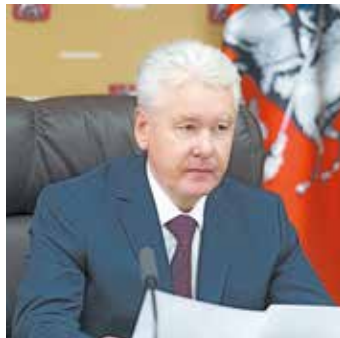
Мэр Москвы С. Собянин

Честность и прозрачность предстоящих выборов в Мосгордуму — одна из ключевых задач, которую поставил перед Избиркомом Мэр Москвы Сергей Собянин. Он еще раз напомнил об этом на заседании президиума Правительства Москвы.