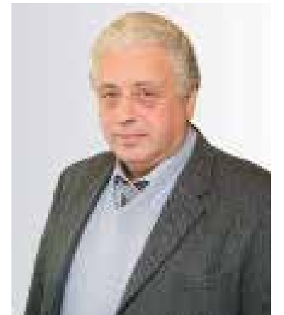
Заместитель Мэра Москвы в Правительстве Москвы по вопросам социального развития Леонид Михайлович Печатников

— введение системы врачей общей практики, что позволит сократить время ожидания приема.