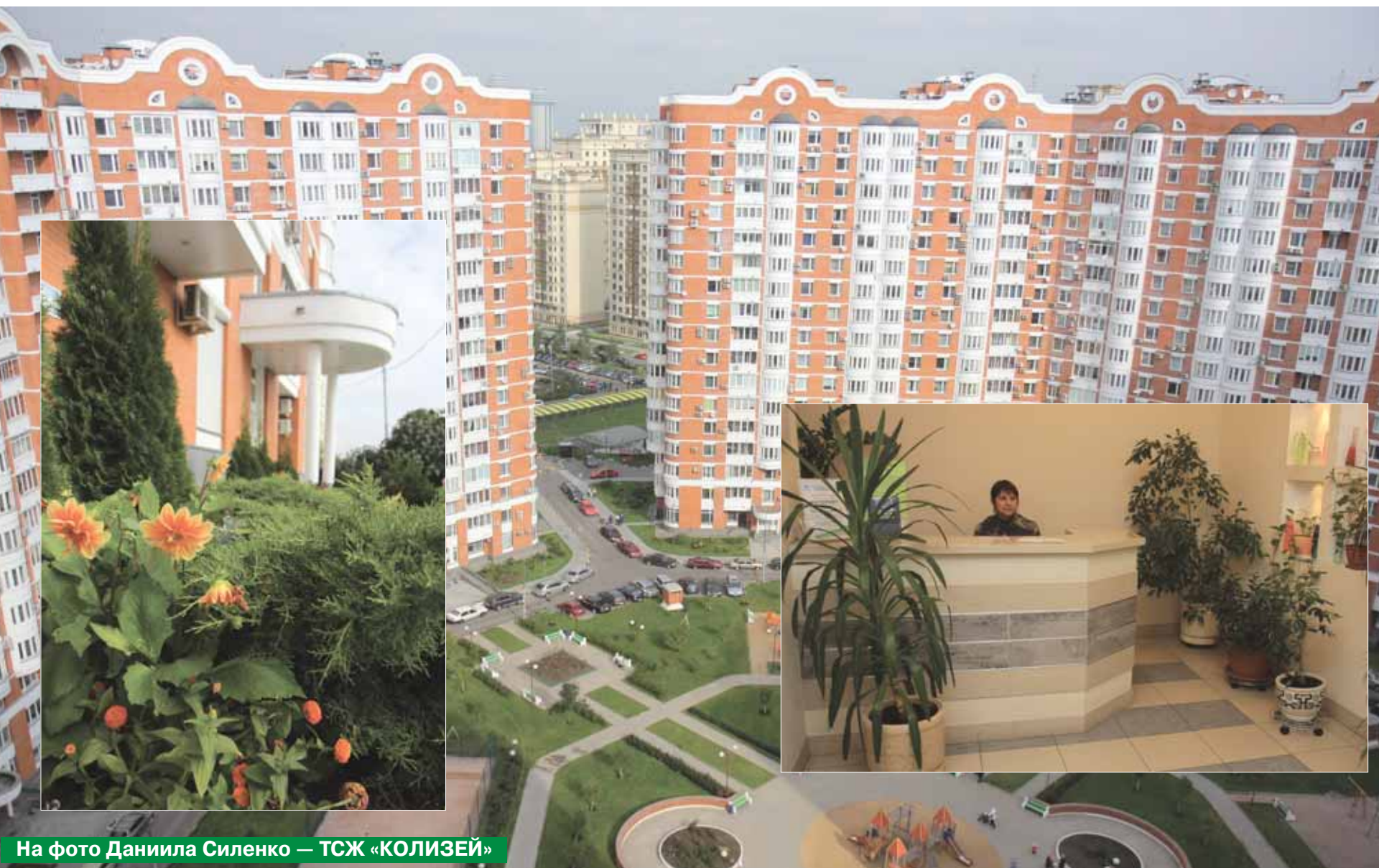
На фото Даниила Силенко — ТСЖ «КОЛИЗЕЙ»