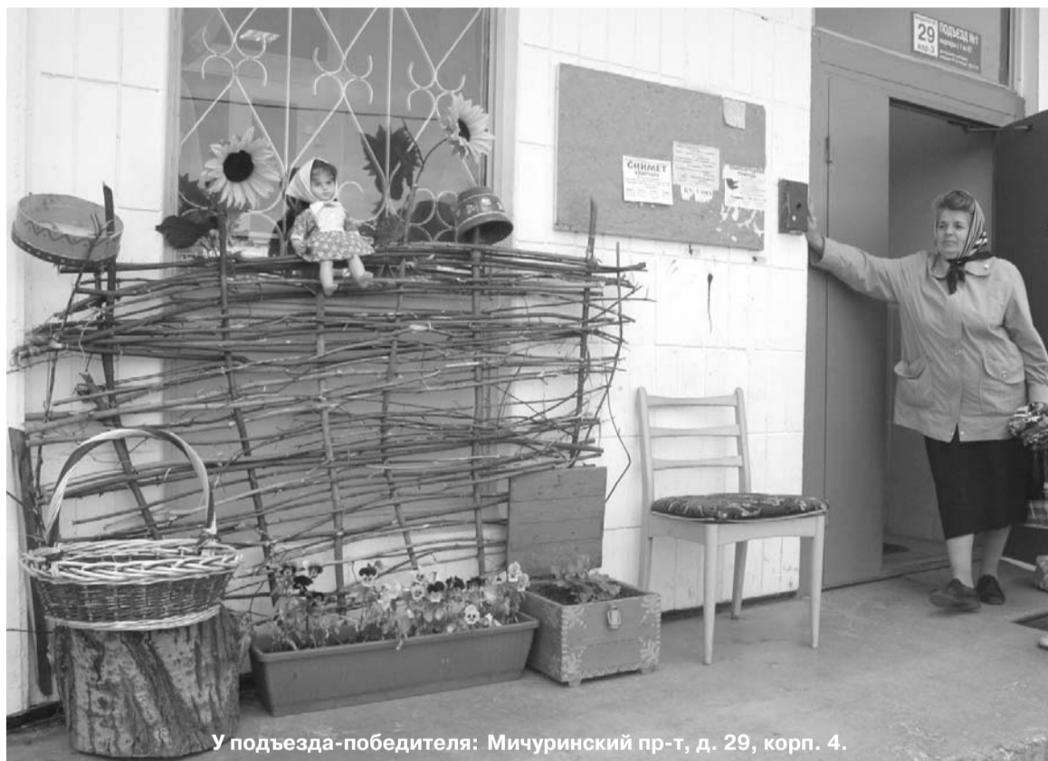
У подъезда-победителя: Мичуринский пр-т, д. 29, корп. 4.

Подведены итоги районного конкурса «Улучшаем свое жилище» 2008 года.