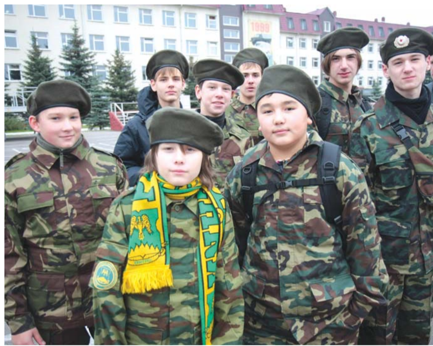
Затем офицеры части провели для юных гостей большую экскурсию по автобазе. Она началась с посещения музея части, где представле-

После возложения венков к памятнику воинам-автомобилистам, погибшим в боях за Родину, приехавшие с призванием сборные команды школьников отправились на военно-спортивную игру «Зарница — спорт», а призывникам в это время вручили ценные подарки: командирские часы и фотоальбом о войнах десантников «Они защищали Отечество».