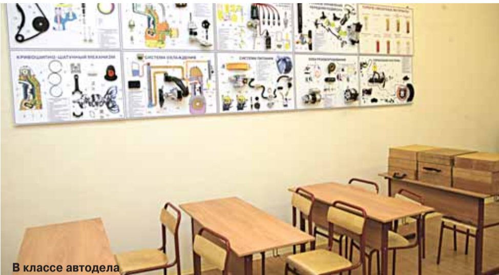
В классе автодела

Для зачисления в лицей необходимы следующие документы: