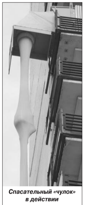
Спасательный «чулок» в действии

В заключение хочется пожелать, чтобы пожар никогда не побывал у вас в гостях.