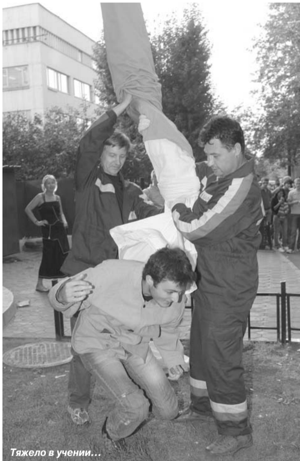
Тяжело в учении...

Проблемы безопасности человека существовали всегда, но именно сегодня они стали особенно острыми и оказались в центре общественного внимания. Воспитание и формирование поведения человека, попавшего в экстремальные или чрезвычайные ситуации, — одна из главных задач государства и общества. Работа пожарной охраны с детьми — важная форма подготовки молодежи к встрече с острыми проблемами современной жизни.