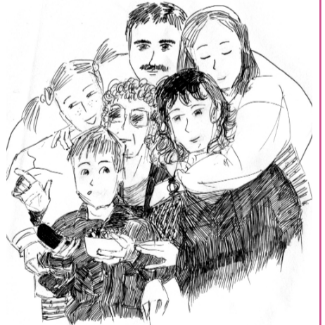
Рисунок Олеси ЧУРАКОВОЙ

Контактное лицо — Ольга Воронина: 8-499-726-1584(85); 8-905-582-5964.